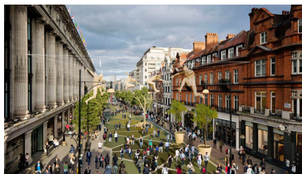
Progetto per la trasformazione di Oxford Street, London, tratta da: https://www.dezeen.com/2017/11/06/plans-unveiled-to-turn-londons-oxford-street-into-a-traffic-free-art-filled-pedestrian-zone-by-end-of-2018/

L'attività relativa alla progettazione, comunicazione e disseminazione dei progetti in tale direzione, attraverso l'istituzione di un Ufficio di pianificazione di genere nelle amministrazioni a livello locale in stretto coordinamento con un piano di legge nazionale e regionale, ha altresì un ruolo fondamentale nella promozione degli obiettivi e la costruzione di una coscienza critica e matura per ogni cittadino, in tutte le fasce di età e condizione socio culturale. Un sistema complesso che darà respiro a tutta la collettività, che potrà determinare e regolare le azioni necessarie per il suo benessere, anche attraverso l'instaurazione delle buone pratiche che hanno già generato risultati ottimali in altre realtà internazionali, come la co-veillance. E per questo, si deve fare appello a tutti quelli che credono nel fare e fare bene, affinché possano costituirsi nuove alleanze e sinergie per costruire in democrazia il nostro futuro, con una nuova idea di umanità. Pensare allo spazio pubblico come motore del cambiamento. In modi diversi e adeguati alle differenti realtà, lo spazio pubblico deve essere inteso come un programma irrinunciabile alla base delle scelte della città, sul quale andranno poi a innestarsi gli altri fattori necessari alla vita di ogni