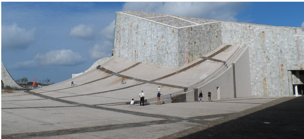
Oviedo, Spagna: Spazi pubblici alla Ciudad de Cultura, (ottobre 2017).