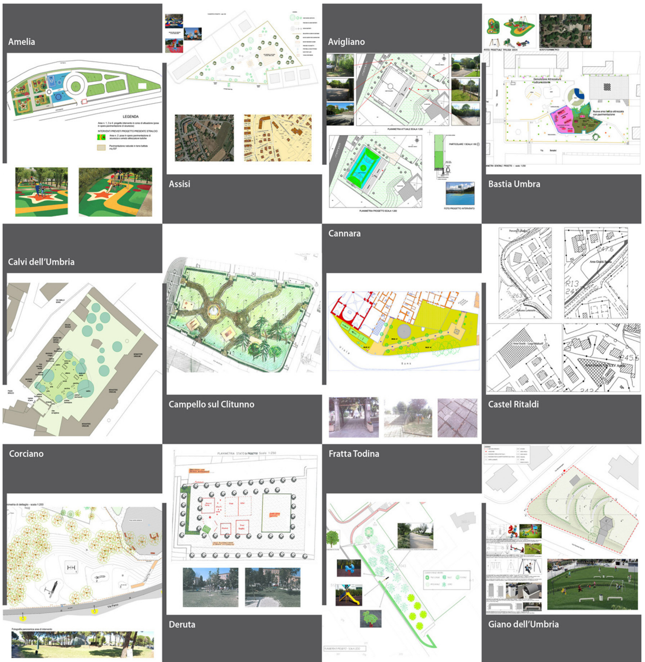
Le proposte presentate dai Comuni di: Amelia, Assisi, Avigliano, bastia Umbra, Calvi dell'Umbria, Campello sul Clitunno, Cannara, Castel Ritaldi, Corciano, Deruta, Fratta Todina, Giano dell'Umbria.