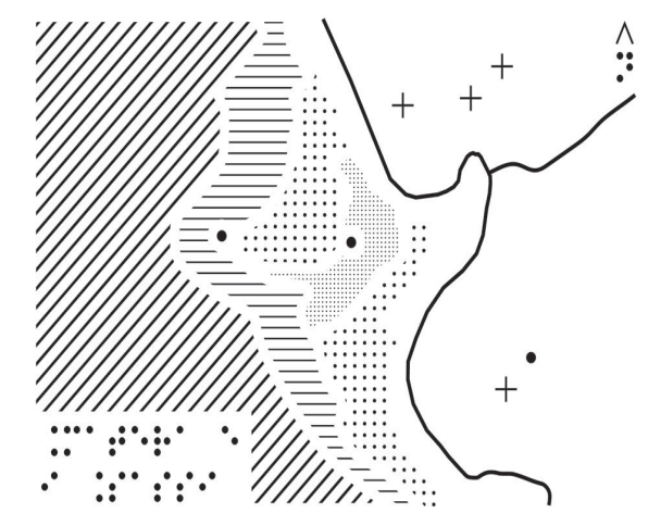
Cartolina Visivo tattile. Le informazioni contenute vogliono rendere il rapporto della città con il paesaggio naturale e urbanizzato nel quale sono inseriti.