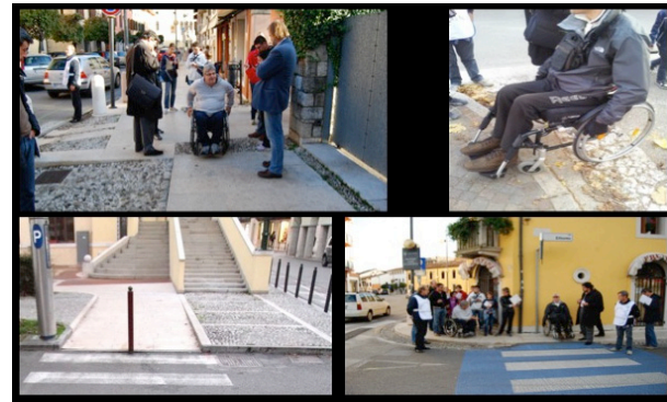
Esempi del gruppo di lavoro durante le fasi di sopralluogo

Progetto LADI (Laboratorio per l'Accessibilità, Domatica e Innovazione), Progetto regionale ASPAD (azioni di sistema per la promozione dell'accessibilità e domiciliarità), Attività di un tavolo permanente comunale, Protocollo d'intesa con la scuola e le associazioni locali, coinvolte con un documento approvato in Consiglio Comunale,