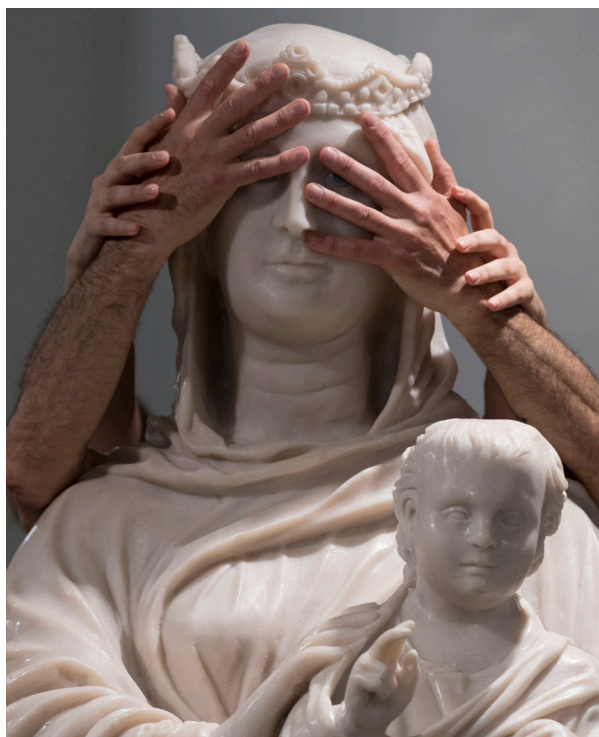
Replica tattile della Maestà di Arnolfo di Cambio, in resina, scala 1:1 - percorso tattile dell'Opera: TouchAble"

Da ottobre 2017 è anche partito un progetto pilota dedicato alle persone con Alzheimer e altre forme di demenza e a coloro che se ne prendono cura. Il progetto prende il nome di "Co-OPERA-tività", che lega alcune parole che si riferiscono ad un senso di collaborazione, di messa insieme di esperienze, competenze, storie, ecc., all'Opera di Santa Maria del Fiore, ed infine alla creatività come anche operosità, attività, elemento importante da stimolare quotidianamente nella vita delle persone anziane in genere e non solo. Il team di lavoro unisce operatori museali e operatori geriatrici, quest'ultimi provenienti da due RSA di Firenze: il Gignoro e Le Magnolie, che collaborano proponendo anche i