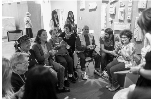
Gruppo di lavoro per realizzare video in LIS per Applicazione de IL Grande Museo del Duomo.